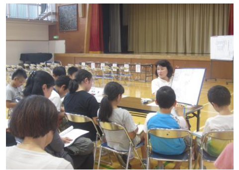
【眼科：味木先生の班】